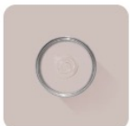
Peignoir No. 286