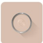
Setting Plaster No. 231