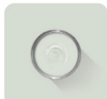
Pale Powder No. 204