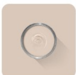
Scallop No. 311